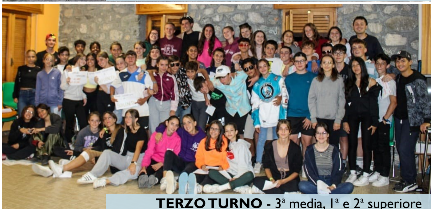
TERZO TURNO - 3 a media, 1 a e 2 a superiore