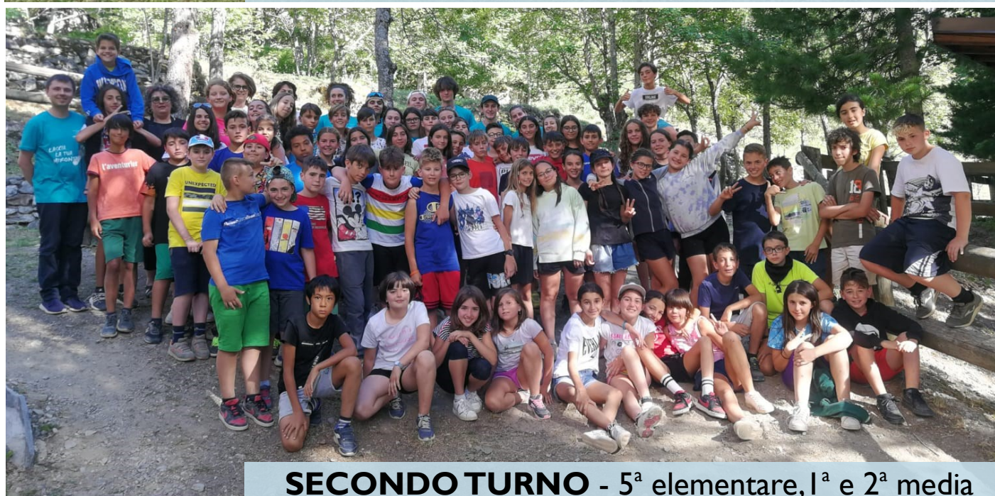
SECONDO TURNO - 5 a elementare, 1 a e 2 a media