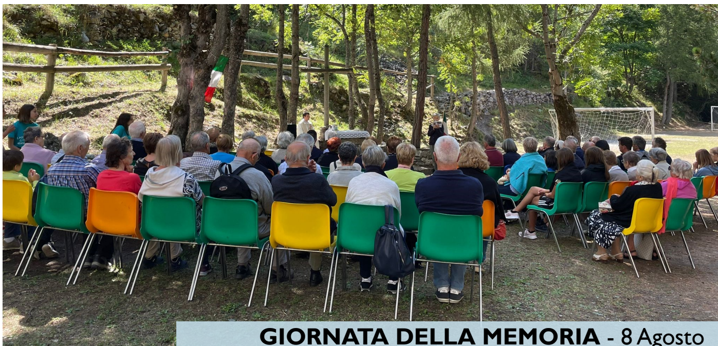
GIORNATA DELLA MEMORIA - 8 Agosto