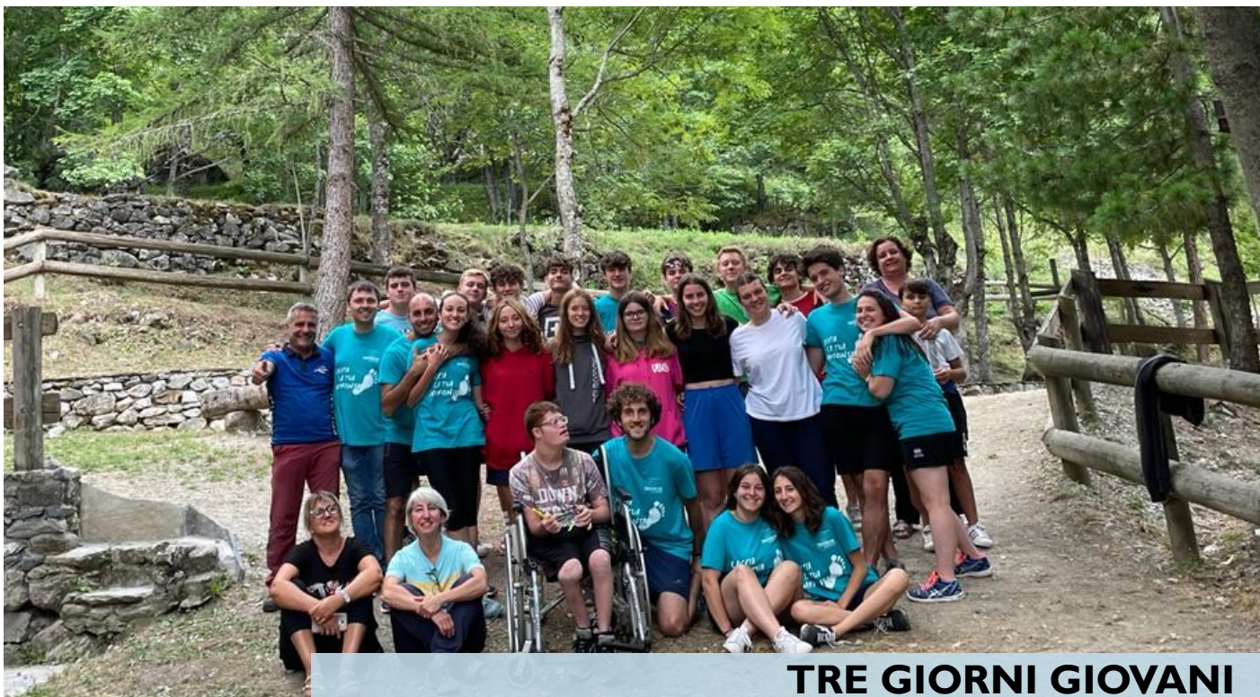
TRE GIORNI GIOVANI