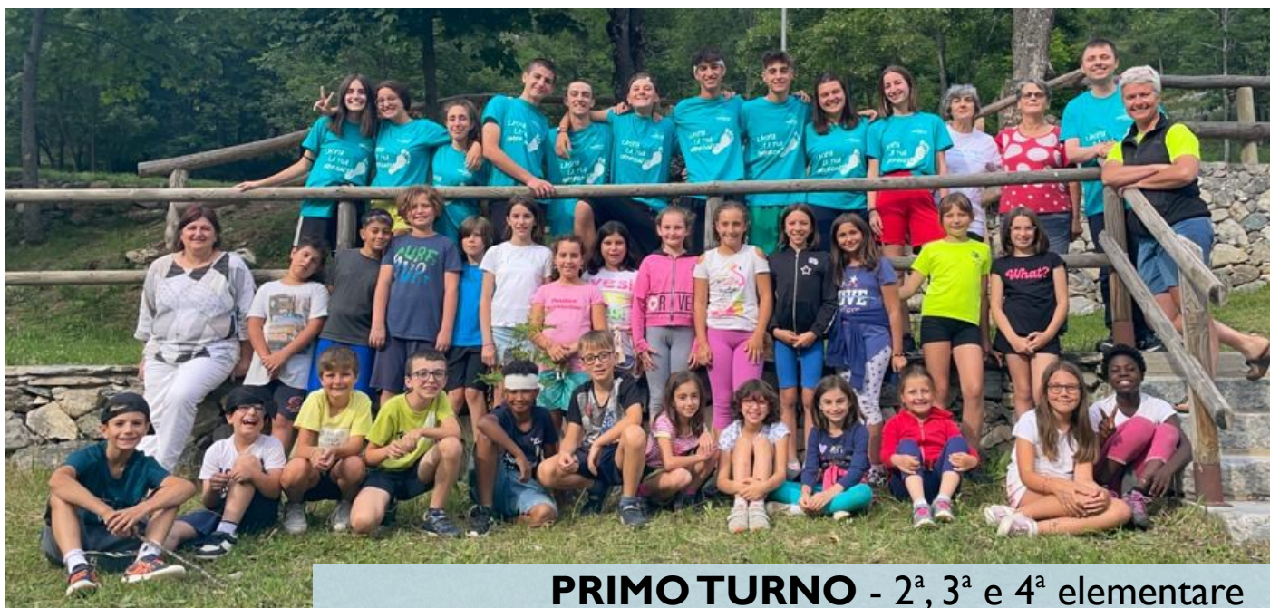
PRIMO TURNO - 2 a , 3 a e 4 a elementare